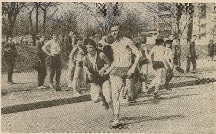
НА ЗДЫМКУ: удзельнікі гарадской эстафеты — студэнты ВДУ імя У. І. Леніна.